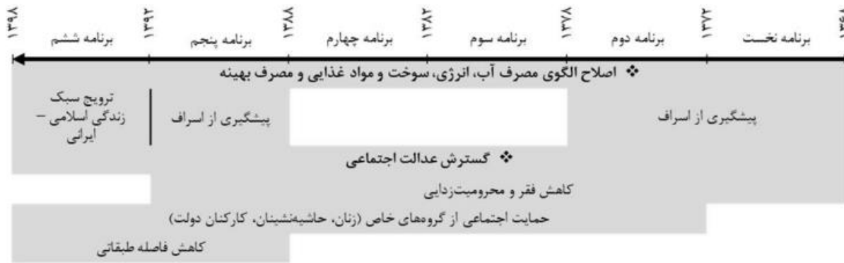
تصویر شماره (۱): دگرگونی سیاست‌گذاری‌های ساماندهی مشاغل شهری (۱۳۶۸-۱۳۹۸ ه.ش) (۲۶)

و تغییر تقاضای سلامت و اقتصاد ناشی از آن بسیاری از مشاغل کوچک و سرمایه‌گذاری‌های کارآفرینی را تعطیل کند. یافته‌ها حاکی از آن است که زیان‌های اولیه فعالیت‌های کسب‌وکار کوچک پیامدهای مهمی برای سیاست‌گذاری، زیان‌های درآمدی و نابرابری اقتصادی داشته باشد [۳۱]. اجرای فاصله‌گذاری اجتماعی باعث شد افراد فعالیت‌های خارج از خانه خود را محدود کنند، در نتیجه گردش مالی کاهش یابد. بنابراین، کسب‌وکارهای کوچک و متوسط که آسیب‌پذیرتر باشند و برخی از آنها درباره مهارت‌های دیجیتال، مرتبط با کسب‌وکارشان آگاهی نداشتند. در واقع، در شرایط کووید-۱۹، کسب‌وکار آنلاین می‌توانست منجر به پایداری در تجارت آنها شود و حتی می‌توانست در آن زمان و در آینده اتفاق بیفتد. کووید-۱۹ می‌توانست با تحول دیجیتال منجر به پایداری در شرکت‌های کوچک و متوسط شود [۳۲]. همچنین موجب شد اکنون شاهد افزایش جمعیت افراد دارای مشاغل خانگی باشیم؛ اما یکی از مهم‌ترین چالش‌هایی که امروزه مدیران کسب‌وکار با آن مواجه هستند، ادغام پایداری در کارکردهای اصلی آنهاست. شرکت‌های فعال در عصر حاضر مجبور هستند از پذیرش صرف شیوه‌های سبز به سمت بازاریابی، طراحی مجدد و توسعه مجدد شیوه‌های تجاری به روشی پایدارتر جهش کنند. از آنجایی که سازمان‌های بیشتری به پایداری متعهد می‌شوند، نگرانی فزاینده‌ای برای