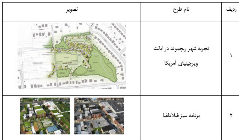
جدول ۴: نمونه‌های موردی