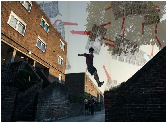
تصویر ۲. پارکور، هنر شهرنوردی

می‌گذارد و مسیرهای غیرمعمول جدیدی را برای تجربه شهر طراحی می‌کند.