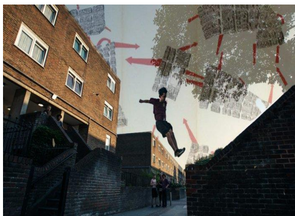
تصویر ۲. پارکور، هنر شهرنوردی

می‌گذارد و مسیرهای غیرمعمول جدیدی را برای تجربه شهر طراحی می‌کند.