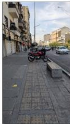
تصویر ۴. مشکلات مبلمان موجود در محور مطالعاتی