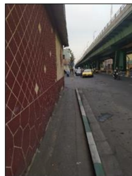
تصویر ۳. مشکلات و موانع در معابر محور مطالعاتی