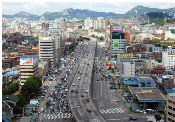
تصویر شماره ۱ و ۲: تجربه تبدیل «بزرگراه چئونگ» به یک فضای شهری سرزنده [۵۱]