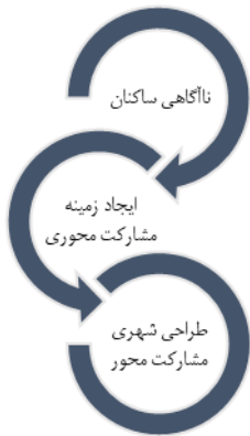
شکل ۲. طراحی شهری پویا با توجه به زمینه‌ی مشارکت‌ها و آموزش‌ها

وگو و مشارکت‌محور نبودن طرح‌ها) و امنیت هستند، در این دسته جای گرفتند. بدین معنا که طراح شهری باید ضمن درک نقش خود به‌عنوان تسهیل‌گر میان مشارکت‌کنندگان و مدیریت شهری، با آموزش شهروندی مشارکت‌کنندگان به ایده‌پردازی پرداخته و پس از تعدیل ایده‌ها به مدیریت شهری در ایجاد برنامه مدون و همه‌جانبه در راستای طراحی شهری مشارکت-محوری کمک کند؛ و مدیریت شهری باید با ایجاد امنیت و جلب نظر مشارکت‌کنندگان با ابزارهایی چون سیاست‌های مدیریتی و ایجاد پویایی اقتصادی مبتنی بر نظر طراح شهری ابلاغ کرده و به‌سوی حفاظت و توسعه بافت تاریخی کازرون گام بردارد.