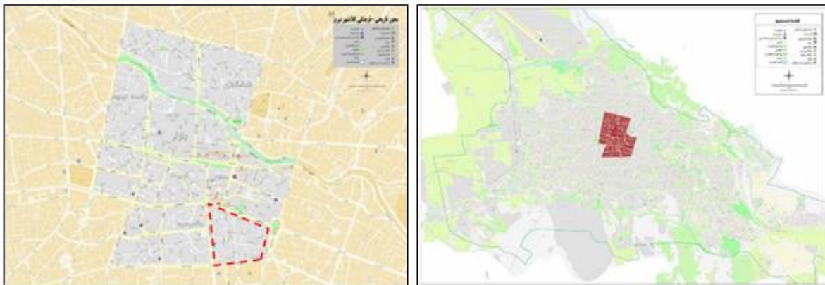
شکل ۱. راست: محدوده‌ی تاریخی- فرهنگی تبریز؛ چپ: موقعیت محدوده‌ی منتخب (بخشی از محله باغشمال تبریز) در محور تاریخی- فرهنگی