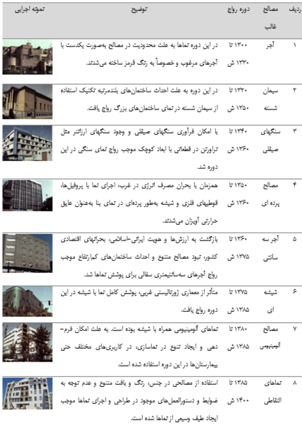
جدول ۲. دسته‌بندی مصالح و روش‌های نماسازی در طول یک قرن گذشته در ایران

می‌توان ادعا کرد که روش‌های ساختمانی به‌طور غالب به اسکلت‌های فولادی و بتنی محدود شد، لیکن فرم‌های ظاهری و نماها همزمان با تحولات و نوآوری در روش‌ها و مصالح ساختمانی در کشورهای توسعه یافته، دستخوش تغییر و تحول شده است. با بررسی ساختمان‌های مختلف با قدمت‌های گوناگون می‌توان تغییر و تحول نماسازی را به دسته‌های مختلف تقسیم‌بندی کرد و تأثیرپذیری نماها را در هر دوره از مصالح و روش‌های رایج روز استنتاج نمود (جدول ۲). [۱۸]