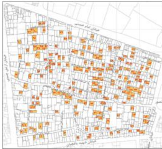
شکل ۲. واحدهای مسکونی کمتر از ۱۰ سال ساخت در محدوده‌ی منتخب پژوهش (بخشی از محله باغشمال تبریز)

نقشه‌های تفصیلی شهر تبریز نمونه‌های مذکور در نقشه‌ی آن محدوده شناسایی و کدگذاری شدند. مجموع نمونه‌های قابل دسترسی ۱۹۳ واحد می‌باشد و در شکل ۲ معین شده‌اند.