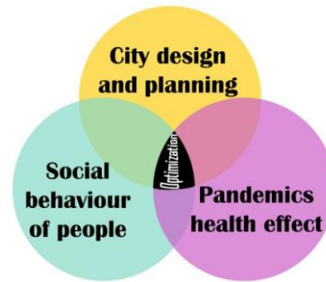
تصویر ۱. ادغام سلامت، اثرات اجتماعی در شهر، مأخذ: Sara, Dalia, 2020. [۳۲].

شدن بیش از حد ایشان با هم، معضلات اجتماعی از جمله افزایش دعوای خانوادگی را دربر داشته است. همین‌طور بسته بودن فضاهای مشاعات که امکان چرخش هوای بیرون در آن وجود ندارد امکان گسترش ویروس در برخی مجموعه‌های مسکونی را می‌تواند بالا ببرد. همچنین نبود فضای مناسب برای خانواده‌های دارای کودک در فضای مشاعات مجموعه‌های مسکونی نیز مهم است. لذا برای معضلات فوق و برای مواجهه با بحران‌های مشابه تعریف بام سبز، در نظر گرفتن بالکن در مامی واحدهای مسکونی با دسترسی به فضای کاملاً باز، مشاعات با دسترسی باز با محیط بیرون، دسترسی به نور خورشید در اکثر فضاهای معماری و همین‌طور فضای امن بازی کودک که چرخش هوای طبیعی را داشته باشد را می‌توان پیشنهاد داد [۲۶]. معماران، برنامه‌ریزان و متخصصان محیط‌زیست، مشتاقند بسیاری از پیامدهای اجتماعی و مکانی را برای تولید الگوهای جدید و تنظیمات، مورد بررسی قرار دهند. امروزه بیشتر معماری، شواهدی از چگونگی واکنش انسان‌ها به بیماری‌های عفونی را با طراحی مجدد فضاهای فیزیکی نشان می‌دهد؛ بنابراین، به نظر می‌رسد مسافت اجتماعی می‌تواند فرایند طراحی و برنامه‌ریزی را تغییر دهد [۳۳].