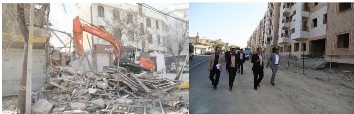
شکل ۳- بافت فرسوده محله شهید خوب بخت تهران (راست)، محله خانی آباد تهران (چپ)

سال‌هاست بافت‌های قدیمی‌تر در مرکز و حاشیه شهرها با مشکلات ناشی از فرسودگی کالبدی، فعالیتی، ساختاری، اجتماعی، زیرساختی و ... مواجه‌اند و طرح‌های گوناگون مداخله در این بافت‌ها تهیه و اجرا می‌شوند. محله شهید خوب بخت تهران به عنوان یکی از اولین محله‌های شهر تهران است که دستخوش انواع سیاست‌های نوسازی قرار گرفته است. آقاصفری و همکاران (۱۳۸۹)، در پژوهش خود با عنوان «بررسی نوسازی و بهسازی بافت فرسوده محله شهید خوب بخت تهران»، در بخش نتیجه‌گیری اعلام می‌دارند: «بررسی طرح‌ها و سندهای برنامه‌ریزی در زمینه محدوده مورد مطالعه، بیانگر آن است که این طرح‌ها به دلیل وجود تنگناهای قانونی و مقرراتی، عدم ارتباط مناسب بین سازمانی، تداخل مدیریتی، عدم توجه به ارزش‌های موجود در محله، عدم توجه به ویژگی‌های اجتماعی-فرهنگی و اقتصادی از کارایی لازم برخوردار نیستند.» [۱۷]. محله‌ی خانی آباد تهران نیز از جمله محله‌هایی است که با فرسودگی مواجه است و مطالعات بنی‌هاشمی و همکاران (۱۳۹۲) در رابطه با آن نشان می‌دهد سیاست‌های نادرست برنامه‌ریزی و طراحی نه تنها تقویت این بخش را به دنبال نداشته بلکه باعث تسریع در فرسودگی آن شده است [۱۸].