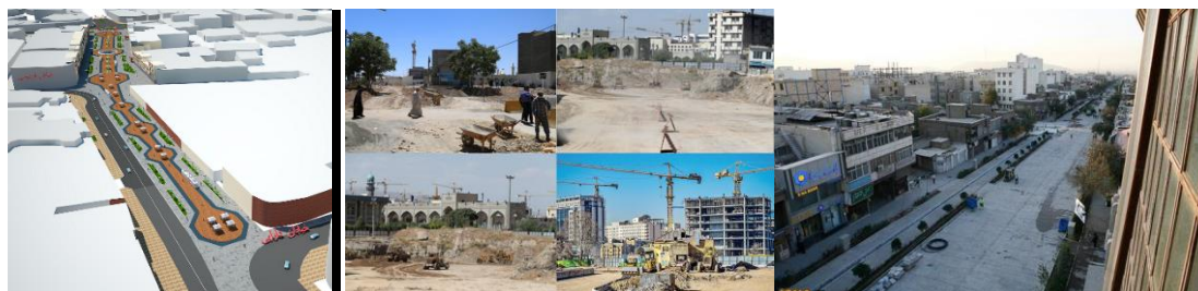
شکل ۲- پیاده‌راه ۱۷ شهریور تهران (راست)؛ طرح پیاده راه جمهوری تبریز (وسط)؛ ره باغ‌های مشهد (چپ)

سنگفرش دانسته و با هدف برداشتن ترافیک و سنگفرش نمودن مسیر یا مسیرهایی از شهر به عمل مبادرت نموده‌اند. از جمله پیاده‌راه‌ها می‌توان به پیاده‌راه ۱۵ خرداد تهران و تربیت تبریز نام برد. همچنین پیاده راه ۱۷ شهریور تهران که با تعارضات مدنی متعددی از سوی کسبه در عدم تغییر کاربری نمایشگاه‌های ماشین موانعی در موفقیت ایران پروژه ایجاد نموده‌اند. همچنین پیاده‌راه خیابان جمهوری تبریز برای مسیر مقابل بازار تاریخی تبریز تهیه شده بود با مخالفت گروه‌های قابل توجهی از کسبه متوقف گردید. یکی دیگر از طرح‌های پیاده‌راهی، طرح ره‌باغ‌های مشهد به سوی حرم مطهر امام رضا (ع) است که اغلب با مداخلات بسیار و ایجاد ترازهای زیرسطحی و تملک اجباری املاک مردمی معارضان مدنی بسیاری را بدنبال داشته است.