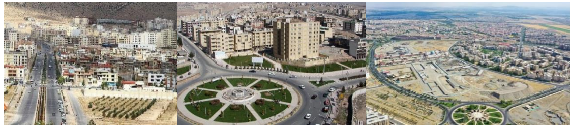
شکل ۵- طرح شهر جدید اندیشه (راست)، شهر جدید هشتگرد (وسط)، شهر جدید صدرا (چپ)