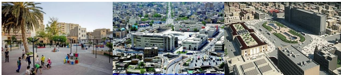
شکل ۴- طرح احیای میدان‌های تهران؛ میدان امام خمینی (ره) (توپخانه) تهران (راست)، میدان شهدا مشهد (وسط)، فضای باز محله‌ای شیرین دخت (چپ)

یکی از مهم‌ترین فضاهای شهری به عنوان محل زندگی جمعی شهروندان، میدان‌های شهری هستند که همواره با هدف ارتقاء کیفیت، دستخوش مداخلات گوناگون قرار گرفته اند. برخی از پروژه‌ها به خوبی اجرا شده و موجب افزایش کیفیت محیط شده اند و برخی دیگر با موانعی رو به رو شده و وضعیت موجود آن را نیز دچار مسائل مختلف نموده‌است. میدان توپخانه یکی از میدان‌های مهم تهران در زمان سلطنت ناصرالدین شاه قاجار شکل گرفته و نخستین میدان تهران است که ویژگی فضاهای شهر مدرن در آن پدیدار شده است [۱۹]. هم‌اینک گودبرداری محل ساختمان بلدی در این میدان، نیازمند توجه و اقدام سریع تری است تا با تکمیل طرح، کیفیت این محدوده بهبود یابد. از دیگر میدان‌های شهری، میدان شهدا شهر مشهد می‌باشد که در مرحله‌ی تملک و تخریب نیز با تعارضاتی مواجه گردید و آنچه امروز شواهد نشان می‌دهد این است که آن گونه که انتظار می‌رفت مورد مقبولیت و استفاده شهروندان واقع نگردیده است. فضای باز محله ای شیرین دخت از جمله پروژه‌های فضای شهری است که با هدف بهبود کیفیت عرصه عمومی در مقیاس محلی در شهر تهران طراحی و اجرا شده است.