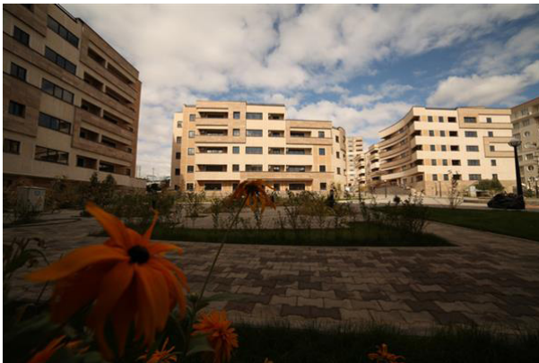
شکل ۲. مجتمع مسکونی سپیدار ارومیه

حجم نمونه از طریق جدول مورگان ۲۹۸، به دست آمد. برای روش نمونه‌گیری از نوع تصادفی ساده استفاده شد.