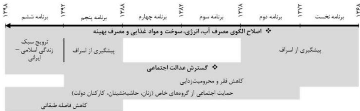
تصویر شماره (۱): دگرگونی سیاست‌گذاری‌های ساماندهی مشاغل شهری (۱۳۶۸-۱۳۹۸ ه.ش) (۲۶)

و تغییر تقاضای سلامت و اقتصاد ناشی از آن بسیاری از مشاغل کوچک و سرمایه‌گذاری‌های کارآفرینی را تعطیل کند. یافته‌ها حاکی از آن است که زیان‌های اولیه فعالیت‌های کسب‌وکار کوچک پیامدهای مهمی برای سیاست‌گذاری، زیان‌های درآمدی و نابرابری اقتصادی داشته باشد [۳۱]. اجرای فاصله‌گذاری اجتماعی باعث شد افراد فعالیت‌های خارج از خانه خود را محدود کنند، در نتیجه گردش مالی کاهش یابد. بنابراین، کسب‌وکارهای کوچک و متوسط که آسیب‌پذیرتر باشند و برخی از آنها درباره مهارت‌های دیجیتال، مرتبط با کسب‌وکارشان آگاهی نداشتند. در واقع، در شرایط کووید-۱۹، کسب‌وکار آنلاین می‌توانست منجر به پایداری در تجارت آنها شود و حتی می‌توانست در آن زمان و در آینده اتفاق بیفتد. کووید-۱۹ می‌توانست با تحول دیجیتال منجر به پایداری در شرکت‌های کوچک و متوسط شود [۳۲]. همچنین موجب شد اکنون شاهد افزایش جمعیت افراد دارای مشاغل خانگی باشیم؛ اما یکی از مهم‌ترین چالش‌هایی که امروزه مدیران کسب‌وکار با آن مواجه هستند، ادغام پایداری در کارکردهای اصلی آنهاست. شرکت‌های فعال در عصر حاضر مجبور هستند از پذیرش صرف شیوه‌های سبز به سمت بازاریابی، طراحی مجدد و توسعه مجدد شیوه‌های تجاری به روشی پایدارتر جهش کنند. از آنجایی که سازمان‌های بیشتری به پایداری متعهد می‌شوند، نگرانی فزاینده‌ای برای