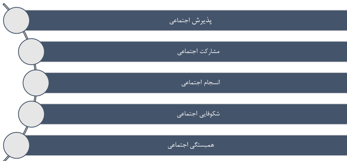
شکل ۱: ابعاد سلامت اجتماعی [۳]

وضعیت نامطلوبی از سطح کیفیت زندگی و رفاه عمومی شهروندی را به بار آورده است. امروزه روند شهرنشینی به وجود آمده به دنبال برخی ویژگی‌های مسائل ناسازگار شهری از جمله کیفیت هوا، بیماری‌ها، افسردگی‌ها، سطح فعالیت‌های بدنی و...، برنامه‌ریزان و دست‌اندرکاران را بر آن ساخت تا در خصوص ایجاد و توسعه فضاهای شهری مبتنی بر سلامت توجه و تأکید مضاعفی را مقبول نمایند. لذا، در اهداف برنامه ریزی و مدیریت شهری که از سوی سازمان ملل ارائه شده است، دسترسی جهانی به فضاهای امن، فراگیر و در دسترس بودن فضای سبز و عمومی برای زنان