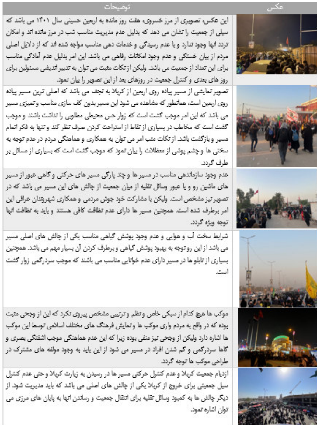
جدول ۷: بازدید میدانی