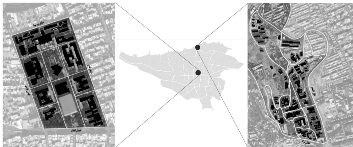
شکل ۳: موقعیت پردیس‌های دانشگاهی منتخب در شهر تهران (تصویر سمت راست: دانشگاه شهید بهشتی، تصویر سمت چپ: دانشگاه تهران)

همچنین انتخاب حداقل دو ترم متوالی به این دلیل بوده است که دانشجویان تجارب گوناگونی را در طول یکسال با وضعیت و شرایط آب و هوایی مختلف، مراسم‌های مناسبتی گوناگون داشته باشد. در مجموع ۴۰ مصاحبه شامل ۲۰ مصاحبه در دانشگاه تهران و ۲۰ مصاحبه در دانشگاه شهید بهشتی مطابق جدول ۳ انجام شد.