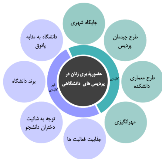
نمودار ۱: مضامین استخراج شده از تجارب فضایی دختران دانشجو از پردیس‌های دانشگاهی منتخب

کالبدی، ب-عوامل غیرکالبدی. بدین ترتیب هر دو پردیس دانشگاهی منتخب در هشت مضمون اصلی مشترک هستند؛ «جایگاه شهری»، «طرح چیدمان پردیس دانشگاهی»، «طرح معماری دانشکده»، «مهرانگیزی»، «اهمیت پاتوق‌گرایی در دانشگاه»، «توجه به شاییت و حقوق دختران دانشجو»، «برند دانشگاه» و «جذابیت فعالیت‌ها و رویدادهای دانشگاهی» (نمودار ۱). مضمون اول تا چهارم مرتبط با عوامل کالبدی، و مضمون پنجم تا هشتم اشاره به عوامل غیر کالبدی محیط دارند. هر یک از این مضمون‌های اصلی چندین مضمون فرعی را در بر می‌گیرند که در هر دو مکان مشترک هستند، اما وزن اهمیت و چگونگی آن‌ها با یکدیگر تفاوت دارد.