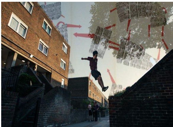
تصویر ۲. پارکور، هنر شهرنوردی

می‌گذارد و مسیرهای غیرمعمول جدیدی را برای تجربه شهر طراحی می‌کند.