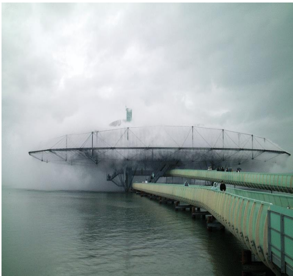
تصویر ۴. سازه ابری، دیلر و اسکفیدو

اقلیمی تغییر شکل یافته و تماشاگران به پرسه‌زنی در میان ابرها می‌پرداختند. این سازه تجمعات تصادفی، تجربه‌های غیرمنتظره و وضعیت‌های مختلف بدنی را نمایش می‌داد. دیلر و اسکفیدو تحت تأثیر بررسی‌های اولیه خود در محیط تئاتری، فناوری و معماری را برای ایجاد زمینه‌های اجتماعی و مادی موقعیت به کار گرفتند. مفاهیم «تماشاگر» و «مشارکت» در پروژه‌های معماری آنها تکرار می‌شود، زیرا هدف آنها استفاده از معماری به نوان زمینه‌ای برای مکاشفه فضایی و لمسی از طریق پیاده‌روی است. این سازه تجربی مصداق گفتمان انتقادی است که رویکردهای معاصر به مکان، پرفورمنس و دراماتورژی معماری را شکل داده‌اند [۶۲].