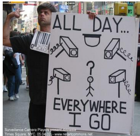
تصویر ۳. بازیگران دوربین‌های مداربسته، نیویورک

ماجراجویان شهری و مردم عادی را به منظور کشف چشم‌انداز فیزیکی و روانی شهر گرد هم آورد. اغلب رویدادهای این گردهمایی بر تجربه مستقیم شهر از طریق پیاده‌روی استوار بود. علی‌رغم تصدیق خاستگاه موقعیت‌گرایانه این گردهمایی، تفاوت آن با تجربه‌ورزی‌های روان‌جغرافیایی پیشین این است که اغلب پروژه‌های آن با نقشه‌برداری دیجیتال و استفاده از رایانه‌ها و رسانه‌ها همراه بود [۶۱].