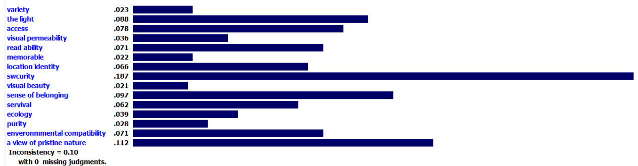
نمودار ۴- اولویت بندی همه زیر معیارها

Priorities with respect to: Goal: criteria subset