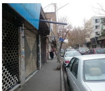
تصویر ۴- جداره فرسوده و فقدان عناصر جاذب در مقیاس دید کودکان

اما در مورد معیار دسترسی نیز آنچه که مورد توجه کودکان بود دسترسی به مکان و دسترسی به کالا بود! کودکان به دسترسی سریع به خدمات و کالا به لطف اینترنت اشاره کردند، اما درباره دسترسی به مکان‌ها این مؤلفه در ارتباط با مؤلفه‌های ایمنی و امنیت قرار دارد. معیار ایمنی، در این مورد اشاره کودکان به کاهش تردد اتومبیل‌ها در خیابان مورد نظر به منظور ارتقاء ایمنی آن‌ها و همچنین توجه به پستی و بلندی‌ها و چاله‌های موجود در پیاده‌روی خیابان بود.