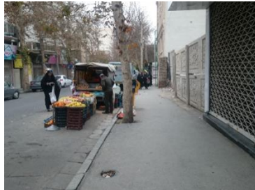
تصویر ۳- ایمنی کم خیابان (چاله‌ها) برای کودکان

کرده‌اند، در مورد حس بساوایی بچه‌ها به نوازش هوای سالم، قطرات باران و همچنین نور خورشید اشاره داشتند. آن‌ها از حضور در فضایی که بتوانند با آب و خاک بازی کنند لذت می‌برند.