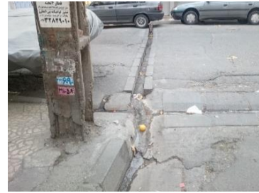
تصویر ۲- وضعیت جوی‌ها، اختلاف سطح‌های مسیر پیاده و سواره