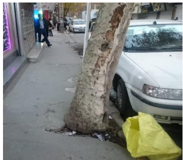
تصویر ۵- وضعیت باغچه‌ها (محل تجمع زباله)