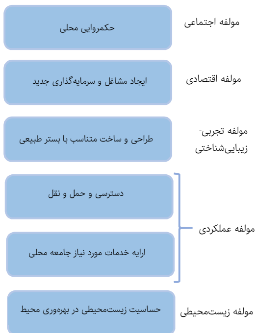
شکل ۱) مؤلفه‌های تجدید حیات پایدار شهری

اما فضاهای باز شهری به مکان‌های فاقد ساخت و ساز اشاره دارند که در استخوان‌بندی فضایی شهر، خالی یا سرباز هستند. در واقع واژه فضای باز شهری به طیف متنوعی از گونه‌ها، ابعاد، اشکال و عملکردها دلالت دارد. فضای باز شهری می‌تواند حیاط ساختمان‌ها، پارک‌های محلی یا شهری، محل بازی کودکان و غیره باشد. فضاهای باز شهری فضاهایی هستند که با وجود سربازبودن، اکثراً به‌منظور عملکردهای تفریحی، زیبایی‌شناسی، کشاورزی و غیره طراحی و ساخته می‌شوند و مجموعه‌ای از خدمات شهری را به ساکنین شهرها عرضه می‌کنند (جدول ۱) [14] .