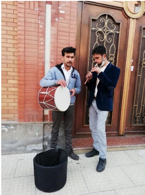
شکل ۲. نوازندگی موسیقی خیابان خیام ارومیه