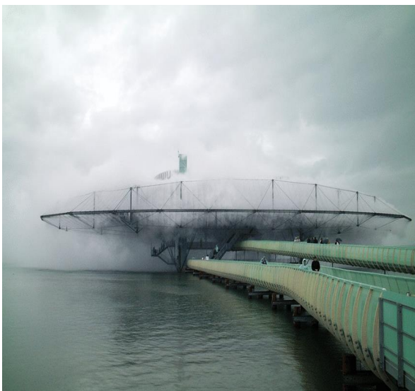
تصویر ۴. سازه ابری، دیلر و اسکفیدو

اقلیمی تغییر شکل یافته و تماشاگران به پرسه‌زنی در میان ابرها می‌پرداختند. این سازه تجمعات تصادفی، تجربه‌های غیرمنتظره و وضعیت‌های مختلف بدنی را نمایش می‌داد. دیلر و اسکفیدو تحت تأثیر بررسی‌های اولیه خود در محیط تئاتری، فناوری و معماری را برای ایجاد زمینه‌های اجتماعی و مادی موقعیت به کار گرفتند. مفاهیم «تماشاگر» و «مشارکت» در پروژه‌های معماری آنها تکرار می‌شود، زیرا هدف آنها استفاده از معماری به نوان زمینه‌ای برای مکاشفه فضایی و لمسی از طریق پیاده‌روی است. این سازه تجربی مصداق گفتمان انتقادی است که رویکردهای معاصر به مکان، پرفورمنس و دراماتورژی معماری را شکل داده‌اند [۶۲].