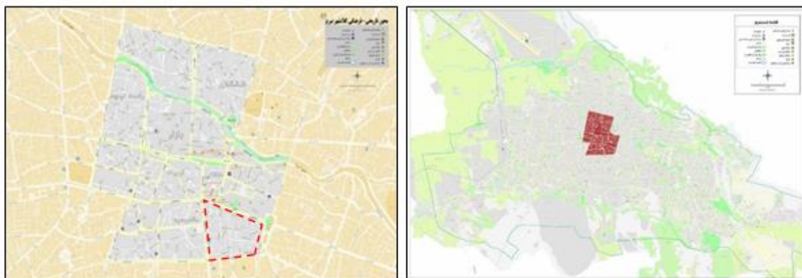
شکل ۱. راست: محدوده‌ی تاریخی- فرهنگی تبریز؛ چپ: موقعیت محدوده‌ی منتخب (بخشی از محله باغشمال تبریز) در محور تاریخی- فرهنگی