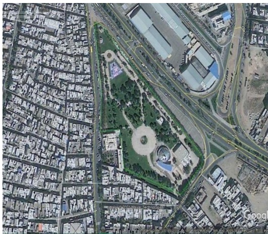
تصویر ۲: عکس هوایی از موقعیت قرار گیری پارک هادی آباد در شهر قزوین

پارک شهدای هادی آباد قزوین در محله هادی آباد قزوین واقع شده است. این محله در منطقه ۲ و شمال غربی شهر قزوین در مجاورت بلوار نواب صفوی و شهید بهشتی است. این منطقه با وجود قرار گرفتن در قلب شهر، تمام ویژگی‌های حاشیه‌نشینی را دارد و بافت فرسوده، مشکلات اقتصادی و آسیب‌های اجتماعی از جمله مواردی است که در این محله دیده می‌شود. محله «هادی‌آباد» در آغاز دهه چهل بعد از اصلاحات ارضی و مهاجرت روستاییان به شهر در زمینی به مساحت ۵۸ هکتار در شمال غربی شهر قزوین ایجاد شد. این منطقه با توجه به معضلات آن هم اکنون یکی از چالش‌های بزرگ مدیریت شهری در شهر قزوین است. پارک شهدای هادی آباد در سال ۱۳۵۸ در این محله تاسیس شد، ابتدا این پارک در نزدیکی شمال غربی محله شکل گرفت اما در ادامه با گسترش شهر از شمال، این پارک در بخش حاشیه‌ای غرب استان قرار گرفت و با توجه به قدیمی بودن محله و در حاشیه بودن پارک، از نظر فرهنگی و اجتماعی دچار تهدید شده است. خیابان‌های مجاور، از سمت شرق، بلوار بهشتی، از سمت جنوب شرقی، خیابان فیاض بخش، از سمت غرب، خیابان حیدری است.