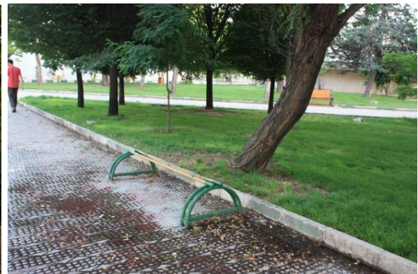
تصویر ۳: نمایی از پارک شهدای هادی آباد شهر قزوین