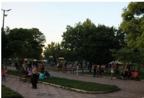
تصویر ۴: حضور مردم در پارک شهدای هادی آباد