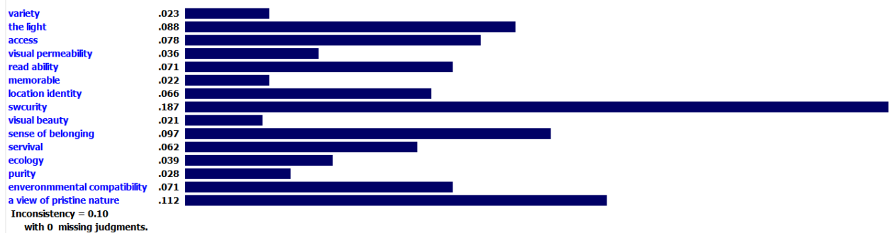
نمودار ۴- اولویت بندی همه زیر معیارها

Priorities with respect to: Goal: criteria subset