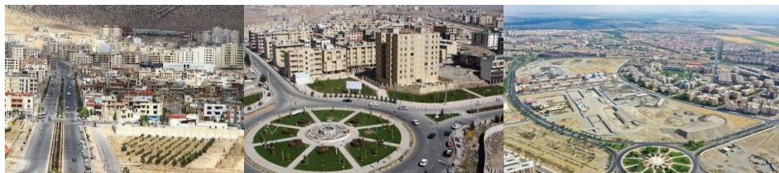
شکل ۵- طرح شهر جدید اندیشه (راست)، شهر جدید هشتگرد (وسط)، شهر جدید صدرا (چپ)