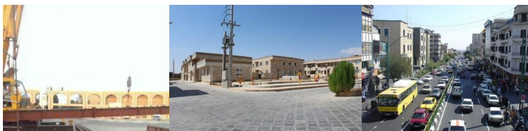
شکل ۶- طرح شهری خیابان کارگر جنوبی (راست)، طرح کف‌سازی و بدنه‌سازی محور کلوان نائین (وسط)، بدنه سازی میدان شاه پهماسب یزد (چپ)

از دلایل عمده آشفتگی و بی‌نظمی کالبدی در شهرها، بی‌توجهی معماران به محیط، در مقیاسی کلان‌تر از طراحی یک ساختمان واحد است. تک‌تک بناها و فضاها به عنوان اجزای یک شهر باید در پیوند با یکدیگر دیده شوند. طرح‌های نماسازی به عنوان راهکاری برای افزایش کیفیت بصری شهرها امروزه مورد توجه طراحان شهری قرار گرفته است. یکی از این طراحی‌ها را می‌توان در پروژه‌ی طراحی شهری بخشی از خیابان کارگر جنوبی تهران دید که با هدف سامان‌دهی یا نظم‌دهی بدنه خیابان صورت گرفته است. از دیگر طرح‌های نماسازی انجام گرفته را می‌توان در پروژه‌ی کف‌سازی و بدنه‌سازی محور کلوان نائین یافت که در بافت فرسوده نائین صورت گرفته و سعی شده در تطابق با معماری سنتی بافت، انجام گیرد. یکی دیگر از این گونه طرح‌ها که در میدان شاه پهماسب یزد صورت گرفته است، بدنه سازی میدان شاه پهماسب (بعثت) ورودی خیابان سید گل‌سرخ است که با در اولویت قرار دادن حفاظت و مرمت میراث فرهنگی، انجام گرفته است.